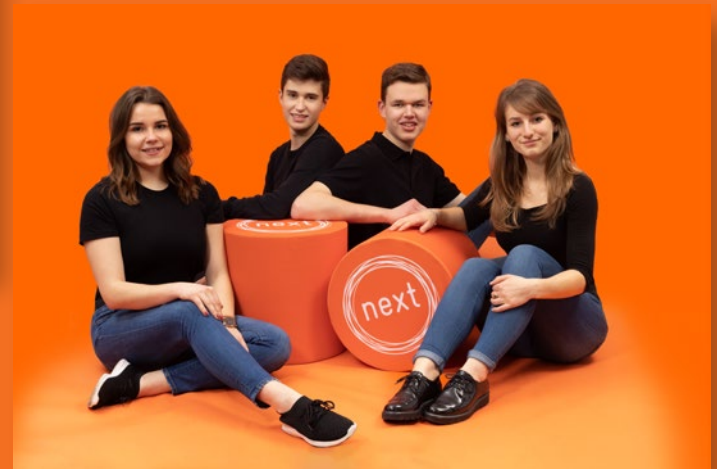
Foto-Shooting für Azubikampagne