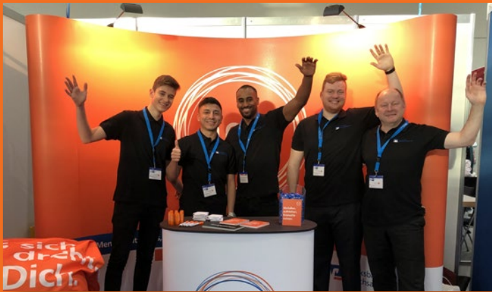
Mitwirkung bei Ausbildungsmessen und Vieles mehr

Auch du wirst Botschafter für unsere besondere Ausbildung. So trägst du auf unseren Ausbildungsmessen einen entscheidenden Beitrag dazu bei, junge Menschen für unsere Ausbildung zu begeistern oder glänzt bei unserem Foto-Shooting für unsere aktuelle Werbekampagne