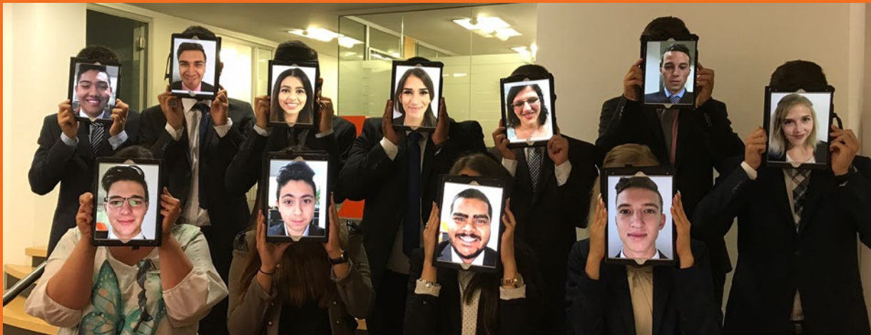
iPad zu Beginn der Ausbildung

Wir denken „Lernen“ neu und stellen dir während deiner Ausbildung vielfältige Lernmöglichkeiten zur Verfügung, um dich ideal auf dein späteres Berufsleben vorzubereiten. Beim Lernen wird dich vor allem ein täglicher Begleiter unterstützen: Dein eigenes iPad, das dir zu deinem Ausbildungsstart übergeben wird. Neben dem Einsatz in der Schule oder abwechslungsreichen internen Schulungen, verwendest du dein iPad zur Wissenserweiterung auf unserer E-Learning-Plattform Prüfungs.TV. Mit verschiedenen Lernvideos zu allen Fachbereichen garantieren wir dir flexibles und individuelles Lernen. Daneben schreibst du mithilfe deines iPads deine Ausbildungsberichte schnell und unkompliziert in einer App, nimmst an E-Konferenzen zu unterschiedlichen Ausbildungsthemen teil oder bereitest unterschiedliche Präsentationen vor. Durch unsere Chat-App bleibst du zudem jederzeit mit deinen Mit-Azubis und Ausbildern in Kontakt.